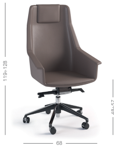
DIREZIONALE CON POGGIATESTA executive chair with headrest