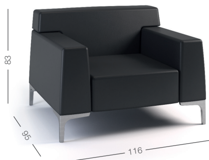
DIVANO 1 POSTO 1 seat sofa