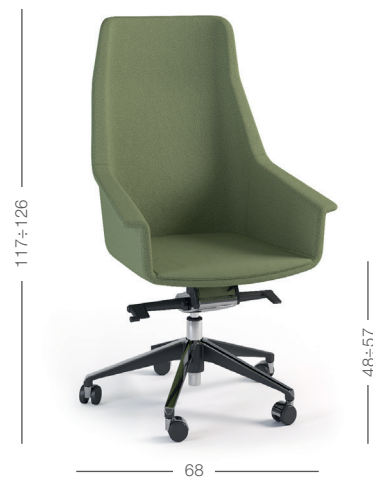
DIREZIONALE executive chair