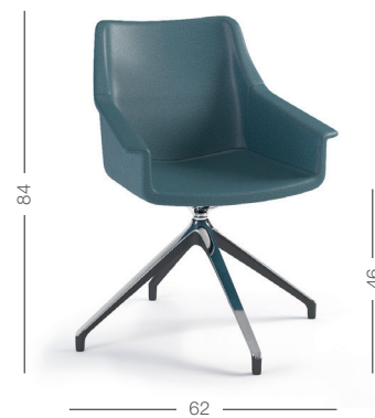
INTERLOCUTORIA GIREVOLE (su piedini) swivel guest chair (on feet)